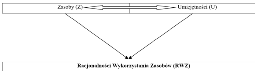
Rys. 1. Prosty model racjonalności wykorzystania Zasobów (RWZ)

Literatura przedmiotu dostarcza wiele podziałów zasobów, które wzbogacają wartość funkcjonowania organizacji. W podziałach tych podkreślana jest różnorodność zasobów. Wieloaspektowe spojrzenie na zasoby tworzy pogląd, że przedsiębiorstwa bez zasobów nie mogą funkcjonować, natomiast ich posiadanie nie gwarantuje osiągnięcia sukcesu przez dany podmiot gospodarczy. Do pełni szczęścia potrzebne są zasoby i umiejętności ich racjonalnego wykorzystania. Można to przedstawić w postaci prostego modelu (patrz rys. 1).